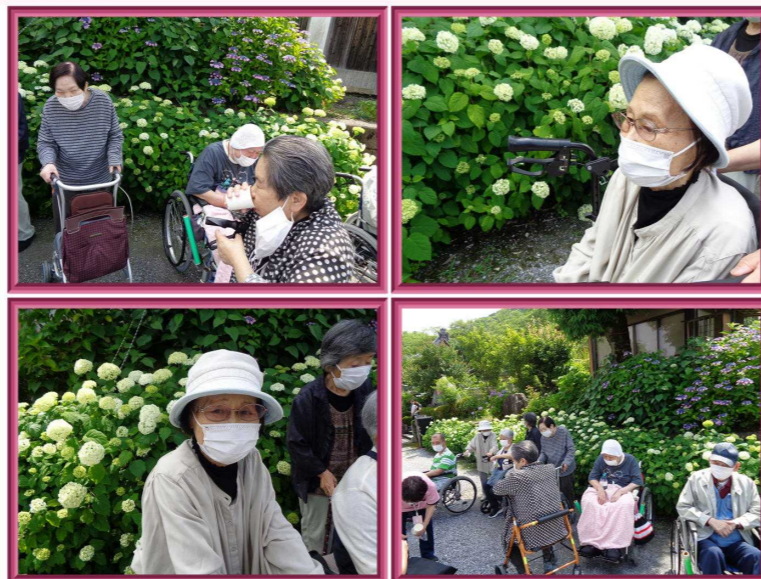
弓削寺(ゆげじ) 揖斐郡池田町