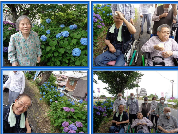
犀川のあじさい街道 大垣市墨俣町

6月5日(金)・6日(土)にデイケアで紫陽花を見に行きました。5日は大垣市墨俣町の犀川堤へ。地域の皆さんの手で植えられた約3,800本もの紫陽花が、青や紫、ピンクなど様々な色合いを見せ、とても華やかな景色でした。6日は揖斐郡池田町の弓削寺へ。境内には数百株の彩り鮮やかな紫陽花が咲き誇り、美しい景色を前にゆっくりと過ごされていました。